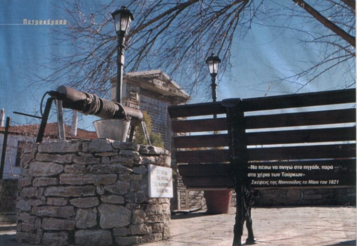
«Να πίσω να πηγαί στο ηγοδι, παρο στο χέρια των Τουρκων- Σελτζούκ της Ναννούδας το Μάιο του 1821