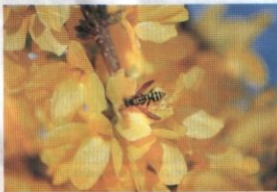
Περνά, περνά η μέλισσα, με τα μελισσοπούλα...

Στα σπλάχνα της φυλάξης την εικόνα της Παναγίας της Οδηγήτριας με τις ε- φτά ροζιτάρης που δέχτηκε επί Τουρ- κοκρατίας στα χρόνια του χαλιωρού.