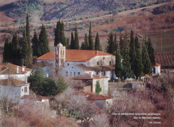
«Όλα τα κομμάτια δείχνουν μεσαυχτά, όλα τα δάκτυλα σιωπή»