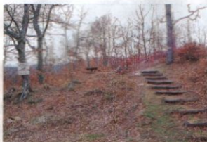
Χίλια μέτρα για να φτάσεις στην κορυφή του Αι-Λια, με στάσεις ξεκούρασης για να πάρεις και κομμάτι ανάσα. Ανέβα, η θέα θα σε αποζημιώσει!

Ένας θεσμός που έπρεπε πάλι όσους να συγκεντρωθεί, να ταξινο-