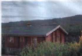
Γκνίτι, λέει, το όνομά σου πραγματικότητα. Με δειντρακατοκία, απόλυτα προσαρμοσμένη στο περιβάλλον της περιοχής

Βρισκόμαστε στην πλατεία των Πετροκέρειας, εκεί όπου εκκέντηται τους νησιώτες του χωριού, κτισμένοι σε παραδοσιακά, να απαλαφίσουν τον «ελλειπώ» τους, την παραδοσιακή τους και να τους διατηρούνται κότερες ως κότες τους. Ένας τόπος για τον οποίο νιώθουν πολύ περήφανοι. Το γκλι, τα το κωσάλλοι και οι συνέσεις.